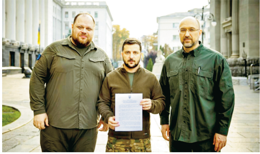
Tổng thống Ukraine Volodymyr Zelensky (giữa) công bố đơn xin gia nhập NATO tại Kiev hôm 30/9.

Giới chức Haiti mới đây thông báo, bệnh tả đã xuất hiện trở lại tại quốc gia này sau 3 năm, khiến ít nhất 7 người tử vong.