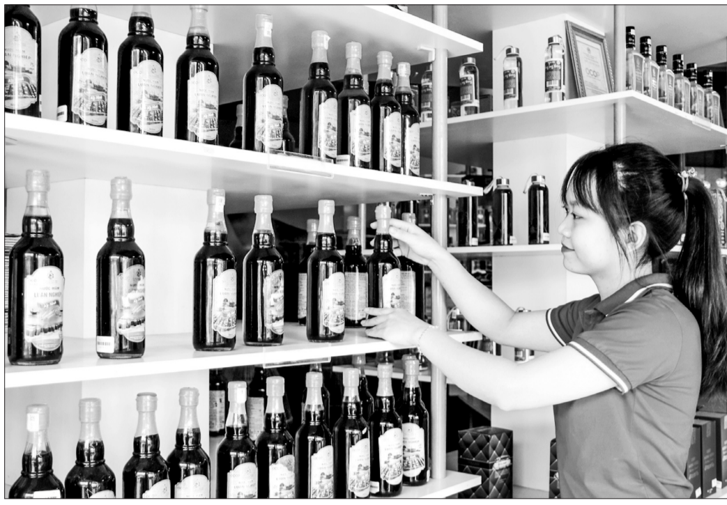
Trung tâm trưng bày, giới thiệu, tiêu thụ sản phẩm OCOP và hàng hóa sản xuất tại Hà Tĩnh Ced Central có đa dạng sản phẩm của nhiều vùng miền trong tỉnh.

Dù mới tham gia OCOP năm 2021 với sản phẩm