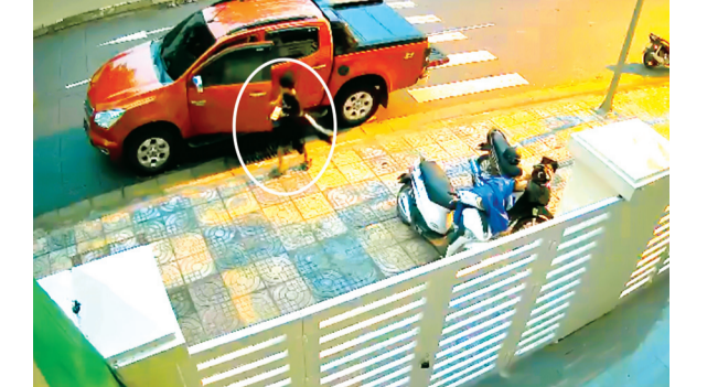
Người dân cần kiểm tra khóa xe an toàn sau khi xuống xe để tránh bị kẻ gian đột nhập lấy cắp tài sản.