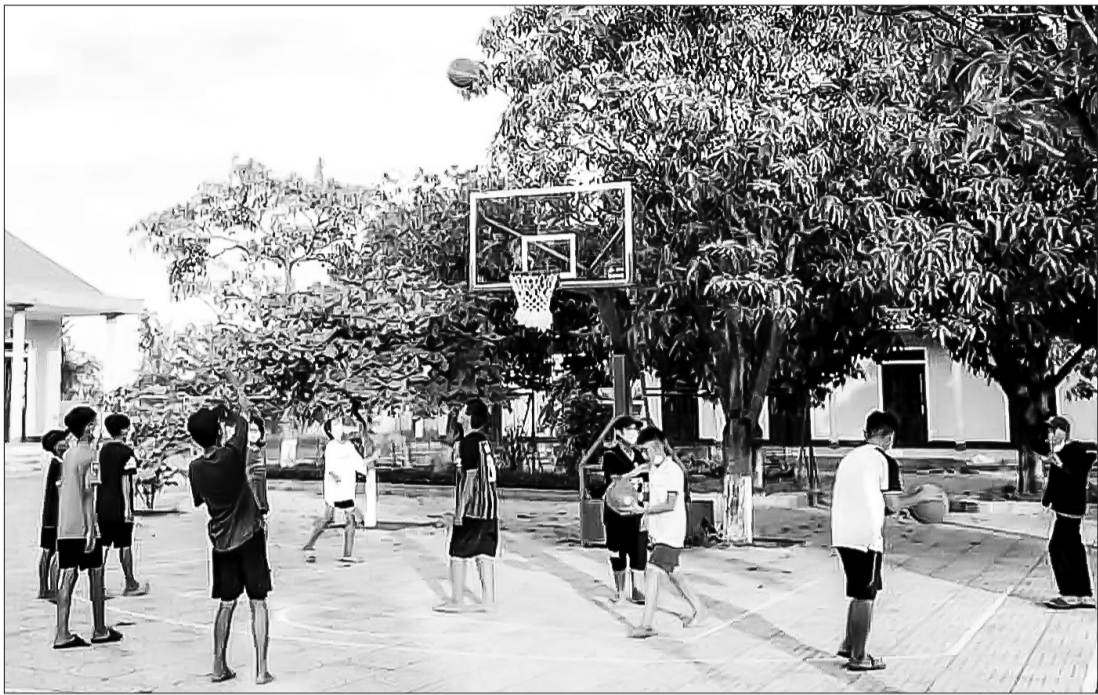
Các câu lạc bộ thể dục thể thao tạo sân chơi bổ ích, giúp học sinh Trường THCS Lê Hồng Phong (Thạch Hà) thư giãn sau mỗi buổi học.