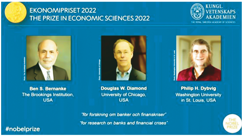
3 nhà kinh tế học người Mỹ đoạt giải Nobel Kinh tế năm 2022.

Viện Hàn lâm khoa học Hoàng gia Thụy Điển đã công bố giải Nobel Kinh tế năm 2022 thuộc về 3 nhà kinh tế học người Mỹ gồm: Ben S. Bernanke thuộc Viện Brookings, Washington DC; Douglas W. Diamond thuộc Đại học Chicago và Philip H. Dybvig thuộc Đại học Washington.