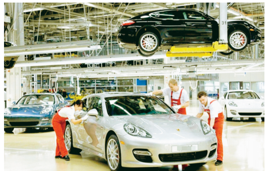
Thiếu hụt năng lượng để phục vụ sản xuất có thể khiến ngành công nghiệp quan trọng của Đức gặp khó trong mùa đông năm nay.

Kinh tế Đức tiếp tục bộc lộ những dấu hiệu giảm tốc nghiêm trọng trong bối cảnh khó khăn chồng chất. Các viện kinh tế hàng đầu của Đức đều dự báo, nền kinh tế Đức sẽ trải qua thời kỳ ảm đạm nhất là tới hết năm 2023.