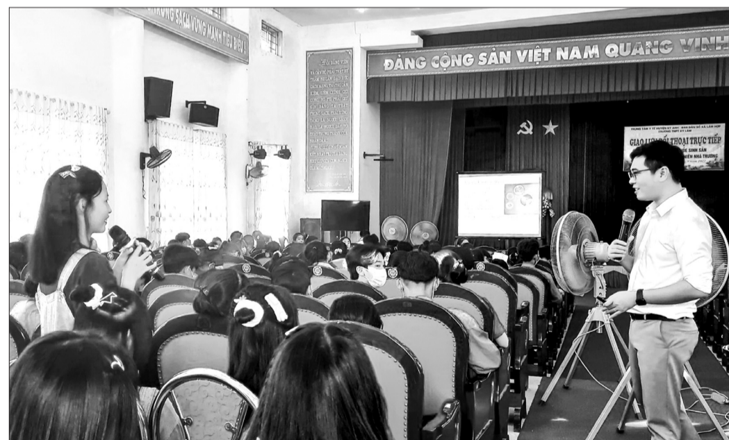
Trung tâm Y tế huyện Kỳ Anh phối hợp với Trường THPT Kỳ Lâm tổ chức diễn đàn giao lưu đối thoại giáo dục giới tính cho học sinh.

ĐẾN THỜI ĐIỂM HIỆN TẠI, ĐÃ CÓ HƠN 10.000 HỌC SINH Ở CÁC TRƯỜNG THPT TRÊN ĐỊA BÀN HÀ TĨNH ĐƯỢC TIẾP CẬN CÁC KIẾN THỨC VỀ GIÁO DỤC GIỚI TÍNH. HOẠT ĐỘNG NÀY ĐANG ĐƯỢC NGÀNH DÂN SỐ PHỐI HỢP VỚI CÁC TRƯỜNG HỌC THỰC HIỆN BẰNG NHIỀU HÌNH THỨC.