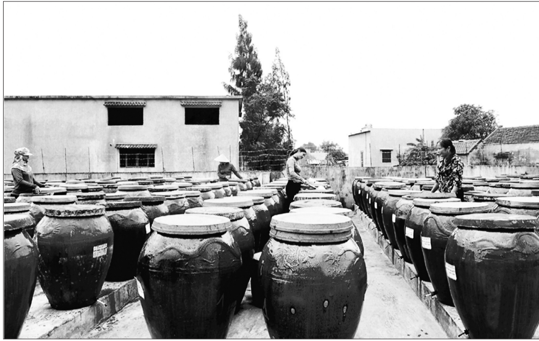
Hoạt động sản xuất của Hợp tác xã Thu mua và Chế biến thủy hải sản Chiến Thắng (xã Kỳ Ninh, thị xã Kỳ Anh).

HTX Dịch vụ nông nghiệp Nhài Duy (xã Kỳ Đồng, huyện Kỳ Anh) thành lập năm 2015 với ngành nghề thu mua, chế biến nông sản. Từ 17 thành viên nay chỉ còn lại 10 thành viên, hoạt động kinh doanh 2 năm qua gặp nhiều khó khăn do dịch COVID-19.