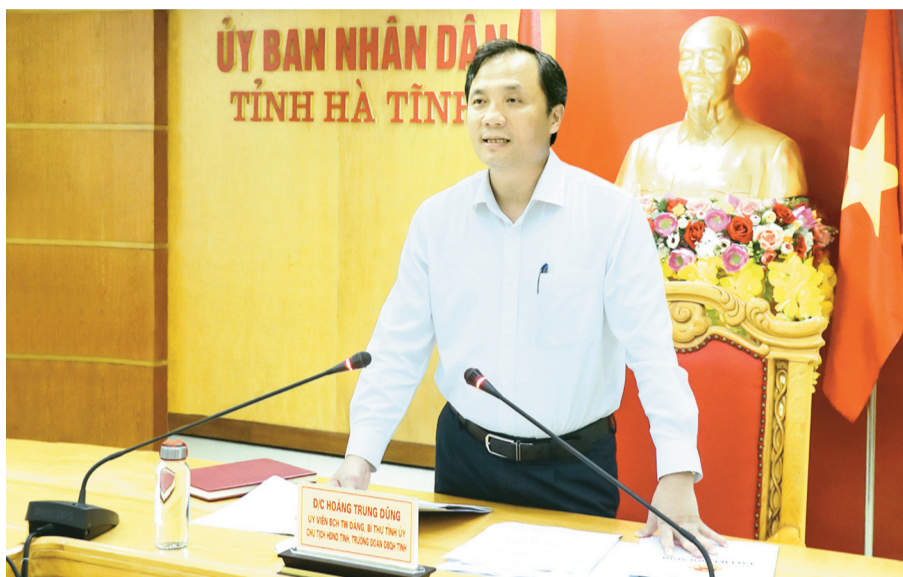
Đồng chí Hoàng Trung Dũng: Tin tưởng tại Kỳ họp thứ 4, Đoàn đại biểu Quốc hội tỉnh sẽ tiếp tục phát huy tinh thần, trách nhiệm cao, đáp ứng lòng mong mỏi của cử tri và Nhân dân tỉnh nhà.