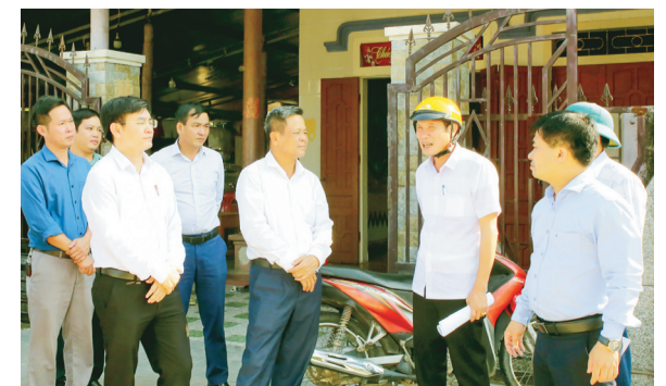
Lãnh đạo Sở Y tế cùng đoàn công tác chỉ đạo phòng chống dịch sốt xuất huyết tại xã Kỳ Bắc.