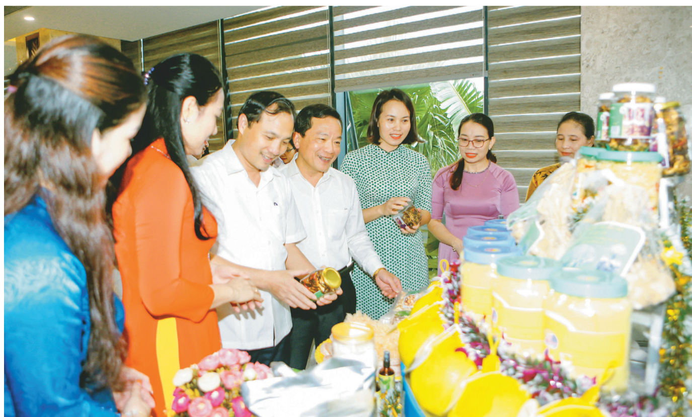
Các đồng chí lãnh đạo tỉnh tham quan các gian hàng khởi nghiệp bên lễ chung kết Cuộc thi Ý tưởng phụ nữ khởi nghiệp năm 2022.