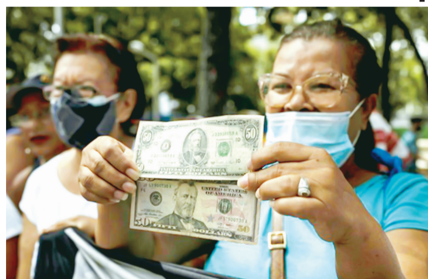
Người phụ nữ cầm tờ đô la Mỹ trong cuộc biểu tình đòi tăng lương ở Caracas, Venezuela ngày 6/9/2022.

Đồng đô la Mỹ tăng giá mạnh khiến cho tình hình tồi tệ hơn ở phần còn lại của thế giới. Nhiều nhà kinh tế lo ngại sự tăng giá mạnh của USD làm tăng nguy cơ xảy ra suy thoái kinh tế toàn cầu vào năm tới.