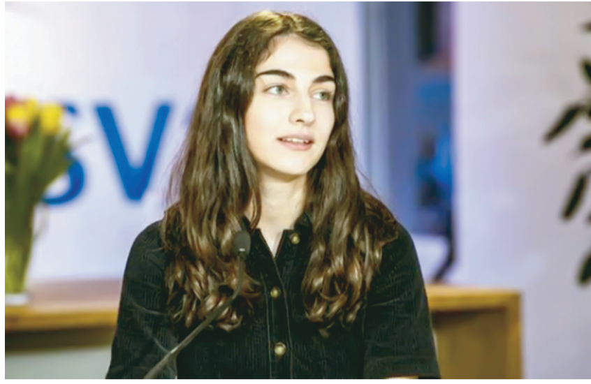
Bà Romina Pourmokhtari trở thành bộ trưởng trẻ nhất trong lịch sử Thụy Điển.

Tân Thủ tướng Thụy Điển Ulf Kristersson đã bổ nhiệm bà Romina Pourmokhtari, 26 tuổi, làm Bộ trưởng Bộ Khí hậu và Môi trường của nước này, trở thành bộ trưởng trẻ nhất trong lịch sử Thụy Điển.