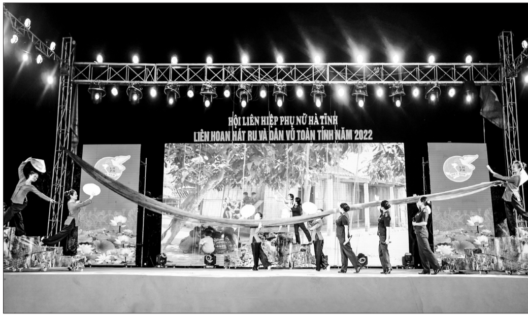
Tiết mục hát ru của Hội LHPN huyện Thạch Hà tại Liên hoan Dân vũ và hát ru toàn tỉnh năm 2022.

Nhiều mô hình tập hợp hội viên đa dạng, hiệu quả