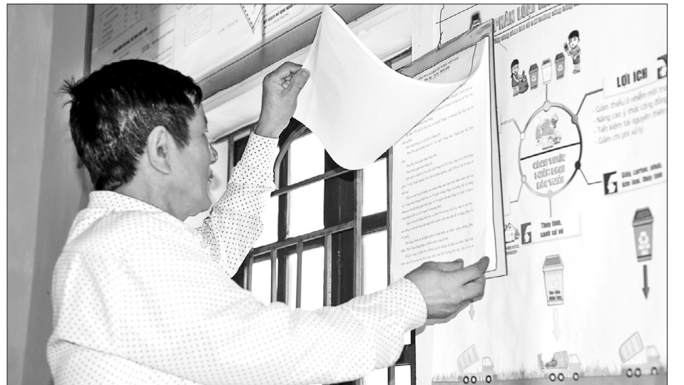
Hương ước được niêm yết tại nhà văn hóa thôn để người dân tiện theo dõi.

Đời sống vật chất và tinh thần của người dân đã thay đổi rõ rệt, toàn thôn không còn vườn tạp, đất bỏ hoang; đường làng, ngõ xóm xanh - sạch - đẹp; nhà dân gọn gàng, ngăn nắp. Thôn đã xây dựng thành công 6 vườn mẫu cấp tỉnh; tỷ lệ hộ nghèo còn 2,27%; thu nhập bình quân đầu người đạt 42 triệu đồng/năm; tỷ lệ gia đình văn hóa đạt hơn 96%; đám cưới, đám tang thực hiện văn minh, tiết