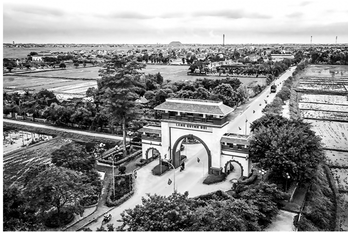
Cổng làng Quỳnh Đôi (Quỳnh Lưu - Nghệ An).