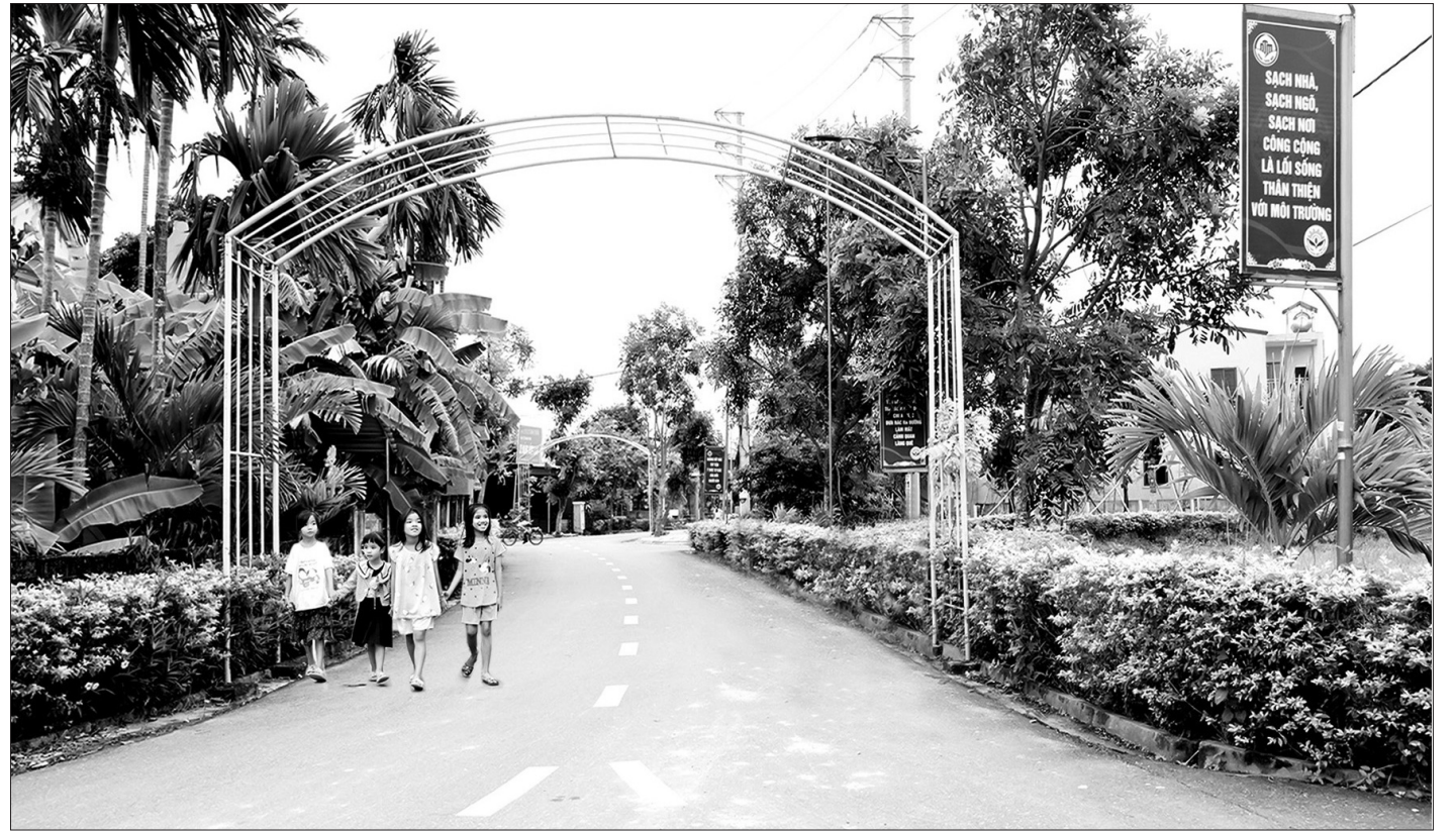
Khung cảnh thanh bình, xanh - sạch - đẹp ở thôn Tam Đồng.

Bản hương ước cũng yêu cầu 100% hộ dân tham gia các cuộc họp thôn; người dân ở độ tuổi nào phải tham gia sinh hoạt ở tổ chức hội đó. Không chỉ vậy, vào chủ nhật hằng tuần, tất cả các gia đình trong thôn đều tham gia tổng dọn vệ sinh đường làng, ngõ xóm theo tổ liên gia. Hương ước quy định rõ thưởng, phạt đối với những ai không thực hiện hoặc vi