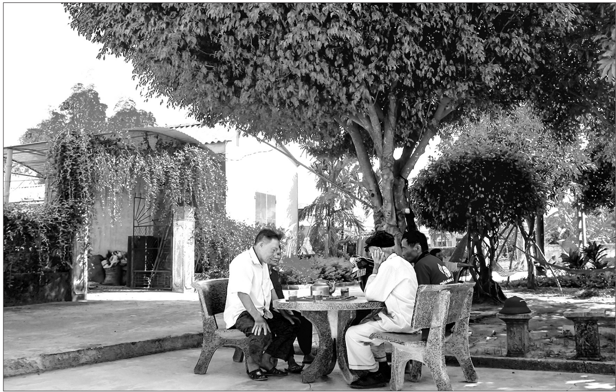
Việc thực hiện hương ước góp phần nâng cao tinh thần đoàn kết người dân trong thôn, tổ dân phố, cùng thực hiện các chủ trương của Đảng và Nhà nước.

Đến nay, toàn tỉnh đã có tổng số 1.817/1.977 thôn, tổ dân phố được thẩm định, phê duyệt hương