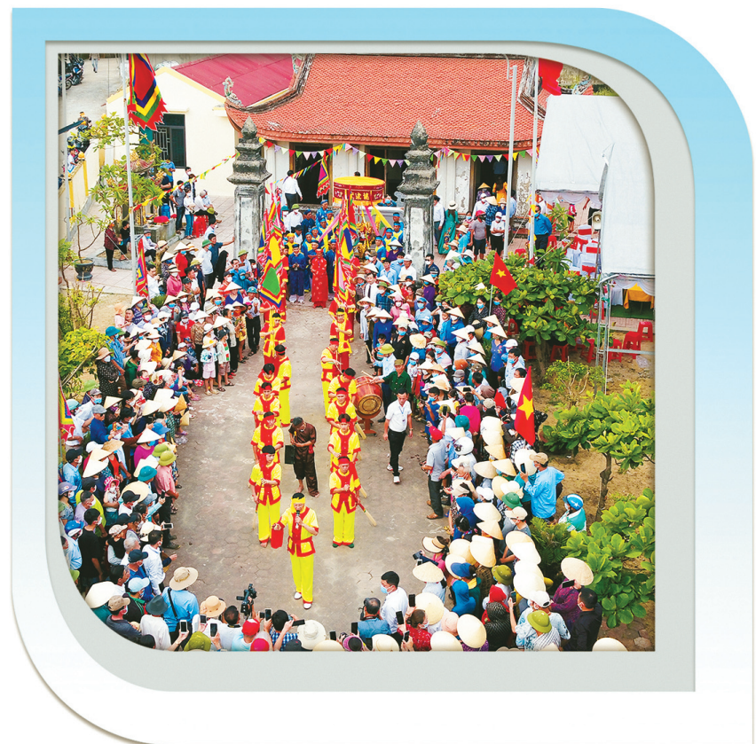
Nhờ thực hiện hương ước, người dân các địa phương ở Hà Tĩnh thêm gắn kết để chung tay xây dựng đời sống văn hóa, nông thôn mới.