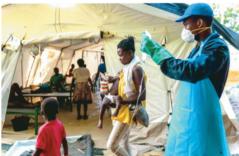
Số ca bệnh tả tăng nhanh tại Haiti trong thời gian gần đây.

Trong nỗ lực hợp hành động nhằm ứng phó các mối đe dọa về y tế, Tổ chức Lương thực và Nông nghiệp của Liên hợp quốc (FAO), Chương trình Môi trường Liên hợp quốc (UNEP), Tổ chức Y tế thế giới (WHO) và Tổ chức Thú y thế giới (WOAH) lần đầu ban hành Kế hoạch hành động chung Một sức khỏe. Quyết định nêu trên là bước tiến quan trọng, góp phần tăng cường hợp tác quốc tế trong bối cảnh thế giới đang đối mặt nhiều nguy cơ về sức khỏe.