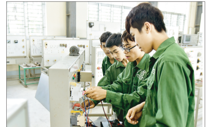
Nghề điện công nghiệp được nhiều học sinh ở huyện Thạch Hà theo học.