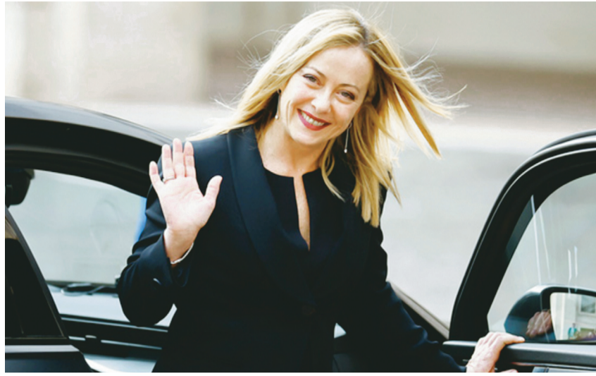
Tân Thủ tướng Italy Giorgia Meloni nhậm chức ngày 22/10.

Bà Giorgia Meloni vừa chính thức tuyên thệ nhậm chức, trở thành nữ Thủ tướng đầu tiên của Italy. Bà Meloni là người đứng đầu liên minh cánh hữu, gồm 3 Đảng Anh em Italy (FdiI), Liên đoàn và Forza Italia (FI), giành được đa số ghế trong cả hai viện của Quốc hội sau cuộc bầu cử sớm ngày 25/9.