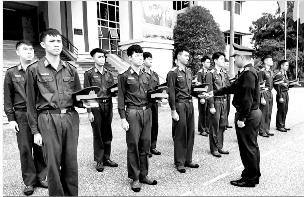
Lực lượng vệ binh Bộ CHQS tỉnh thường xuyên kiểm tra, chấn chỉnh lễ tiết, tác phong quân nhân trước khi thực hiện nhiệm vụ.