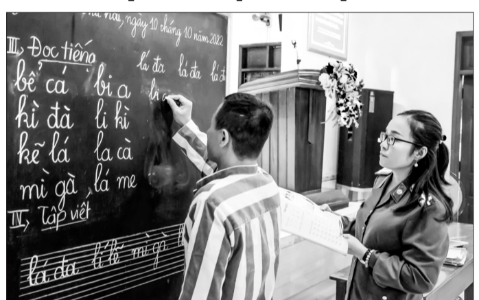
Nhiều phạm nhân quyết tâm học chữ để sớm viết thư về cho gia đình.

thía nỗi nhớ gia đình, người thân. Đây cũng là động lực để phạm nhân này kiên trì theo học lớp xóa mù chữ với mong muốn đơn giản là viết một bức thư về cho vợ con ở nhà.