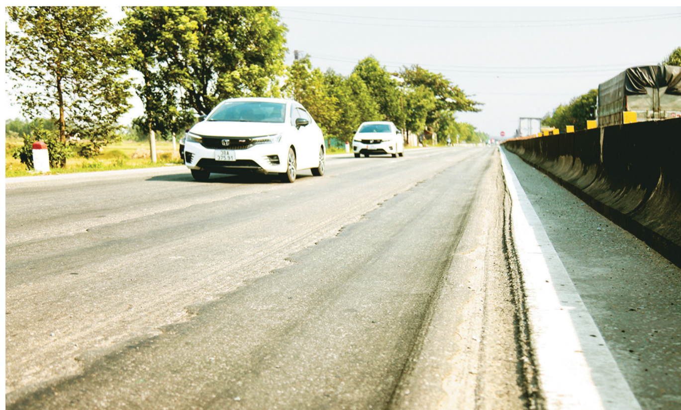
Bề mặt quốc lộ 1 đoạn qua xã Vương Lộc (Can Lộc) trông không khác gì "luống khoai", dễ dẫn tới tai nạn giao thông cho người và phương tiện qua lại (Ảnh chụp chiều 18/10).