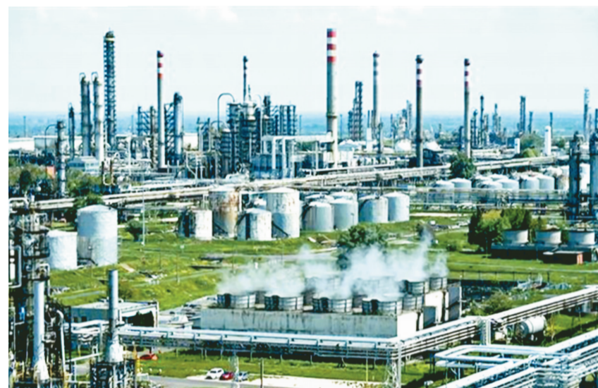
Một cơ sở lọc dầu ở gần thị trấn Szazhalombatta (Hungary).

Tại Hội nghị thượng đỉnh từ ngày 20 - 21/10 ở Brussels (Bỉ), lãnh đạo các nước EU đã nhất trí về lộ trình nhằm ứng phó với cuộc khủng hoảng năng lượng hiện nay với 3 mục tiêu quan trọng: hạ giá năng lượng, đảm bảo an ninh nguồn cung và giảm nhu cầu. Tổng thống Pháp Emmanuel Macron nhấn mạnh rằng, thỏa thuận này đã gửi đi tín hiệu về sự quyết tâm và đoàn kết của khối. Trong khi đó, Thủ tướng Đức Olaf Scholz đánh giá, EU đã đạt được tiến triển tốt trong vấn đề năng lượng.