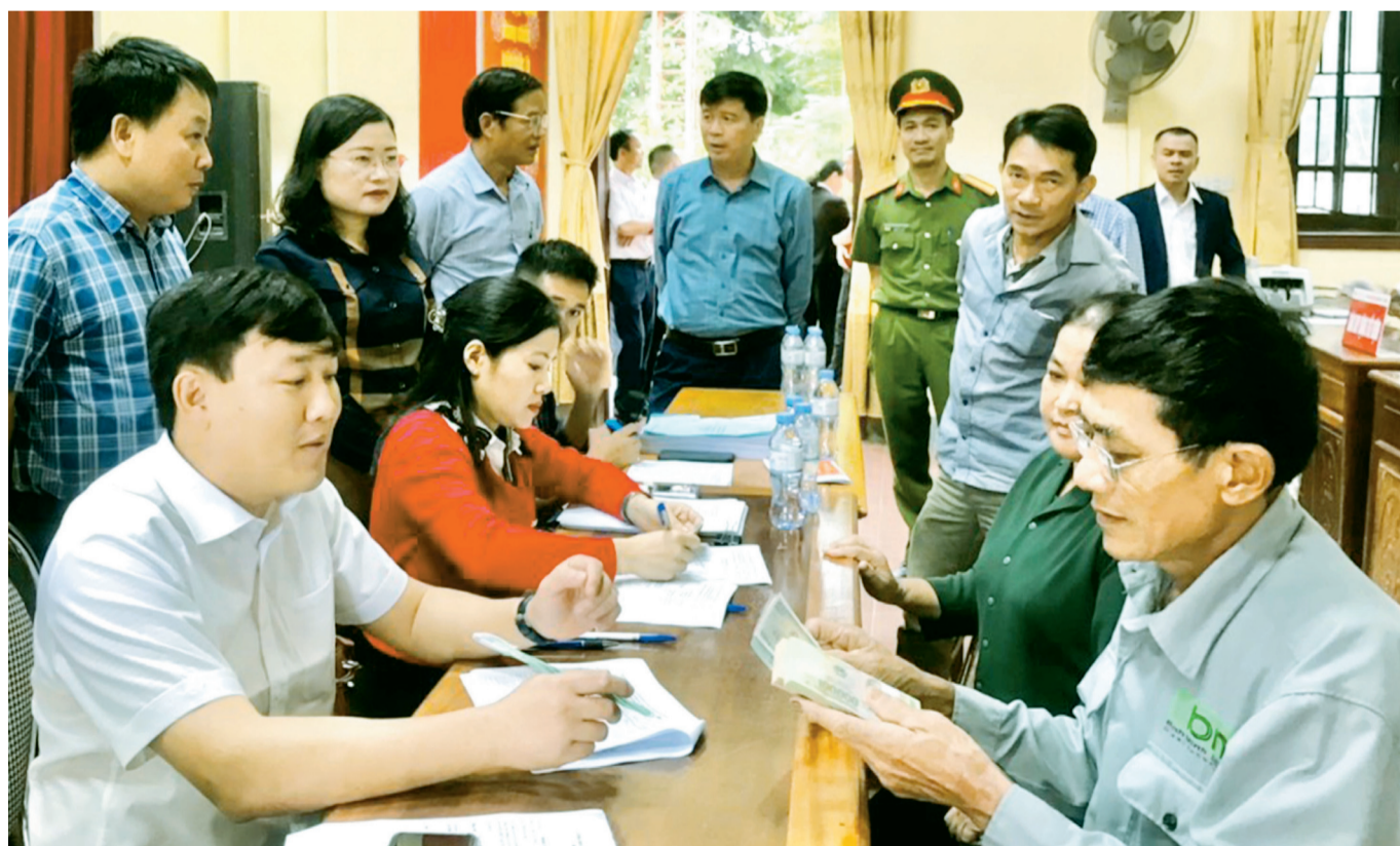
Hội đồng bồi thường giải phóng mặt bằng dự án cao tốc Bắc - Nam huyện Thạch Hà chi trả tiền bồi thường cho người dân bị ảnh hưởng.