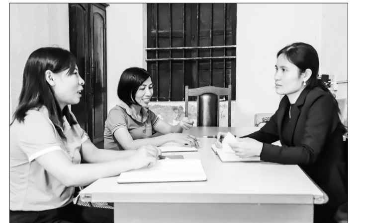
Cán bộ mặt trận và các tổ chức đoàn thể thường xuyên phối hợp triển khai hiệu quả công tác huy động nguồn lực cho người nghèo.

Linh hoạt, khéo léo trong cách thức vận động, Ủy ban MTTQ xã Thạch Liên (Thạch Hà) đã huy động hiệu quả nguồn lực để chăm lo cho người nghèo, hỗ trợ các hoàn cảnh khó khăn trên địa bàn.