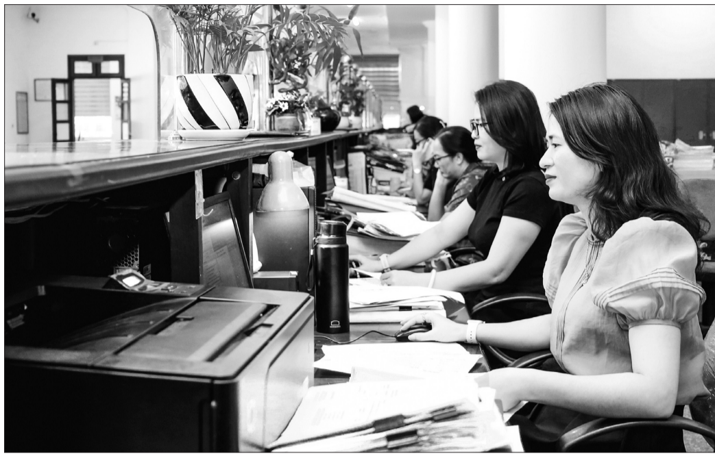
Các giao dịch viên Kho bạc Nhà nước Hà Tĩnh tiếp nhận hồ sơ thông qua dịch vụ công trực tuyến.

Thực hiện thành công Chiến lược phát triển KBNN, các hoạt động CCHC, hiện đại hóa của KBNN Hà Tĩnh được đẩy mạnh, đồng bộ trên các mặt nghiệp vụ. Hiện, KBNN Hà Tĩnh đã triển khai DVCTT ở mức độ 4 giúp các đơn vị thanh toán, chuyển rút tiền với KBNN thuận lợi. Thời hạn xử lý hồ sơ giảm trong phạm vi