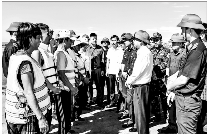
Các lực lượng chức năng ở Lộc Hà nhắc nhở ngư dân đảm bảo an toàn khi sản xuất và chấp hành nghiêm quy định về đánh bắt, khai thác thủy hải sản trên biển.

Các đơn vị chức năng ở Lộc Hà luôn nỗ lực để kịp thời đưa các chủ trương, chính sách, pháp luật của Đảng và Nhà nước đến với người dân, nhất là những vấn đề mới, “nóng”, thiết thực, gắn gũi với cuộc sống.