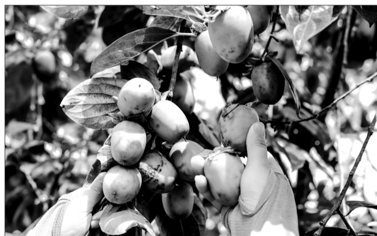
Hiện nay, toàn thôn Yên Du có 80 hộ trồng hồng với diện tích khoảng 40 ha.

Những ngày này, bà con thôn Yên Du, xã Đức Lĩnh (Vũ Quang) đang bước vào mùa thu hoạch hồng giòn chính vụ. Được mùa, giá bán lại cao nên nhiều nông dân nơi đây “bỏ túi” hàng trăm triệu đồng.