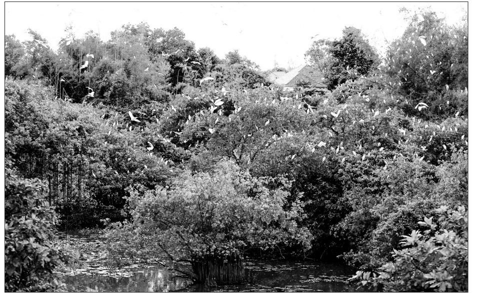
Từ ngày có đàn cò về làm tổ, đầm Bù được ví như một “U Minh thu nhỏ”.

4 năm trước đến tháng 8 năm sau. Mỗi năm, bình quân lúc đông nhất cũng có tới hơn 30.000 con về trú ngụ. Ngày nào cũng vậy, cứ khoảng 6h sáng, đàn cò sẽ bay đi tìm kiếm thức ăn, đến 5h chiều, chúng sẽ bay về đây” - ông Hoàng chia sẻ.