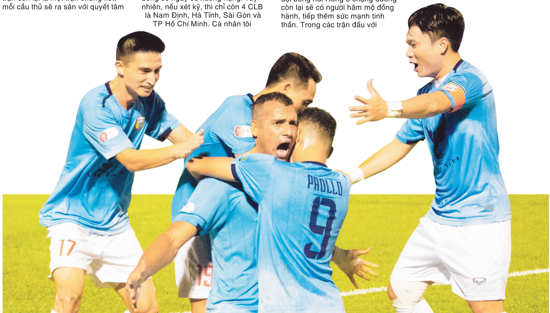
Hồng Lĩnh Hà Tĩnh vẫn đang nỗ lực qua từng trận đấu để trụ hạng.

V.League 2022 chỉ có một đội xuống hạng, cánh cửa ở lại giải đấu ngày càng hẹp với những đội bóng như TP Hồ Chí Minh, Sài Gòn và cả HLHT. Đây chính là thời điểm kiểm chứng sức mạnh thực sự của các đội bóng. Hơn bao giờ hết, người hâm mộ chờ đợi HLHT chứng tỏ được bản lĩnh của mình để bước qua cánh cửa hẹp và trụ lại giải đấu cao nhất của bóng đá Việt Nam.