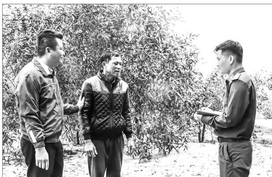
Lực lượng chức năng phối hợp cán bộ đoàn thể tuyên truyền để nâng cao nhận thức cho người dân về bảo vệ môi trường sống tự nhiên, từ bỏ việc đánh bắt chim hoang dã.

Sau khi Báo Hà Tĩnh phản ánh tình trạng này, cùng với sự chỉ đạo quyết liệt từ tỉnh, huyện thì chính quyền xã Yên Hòa đã quyết tâm chấn chỉnh để chấm dứt nạn tận diệt chim trời.