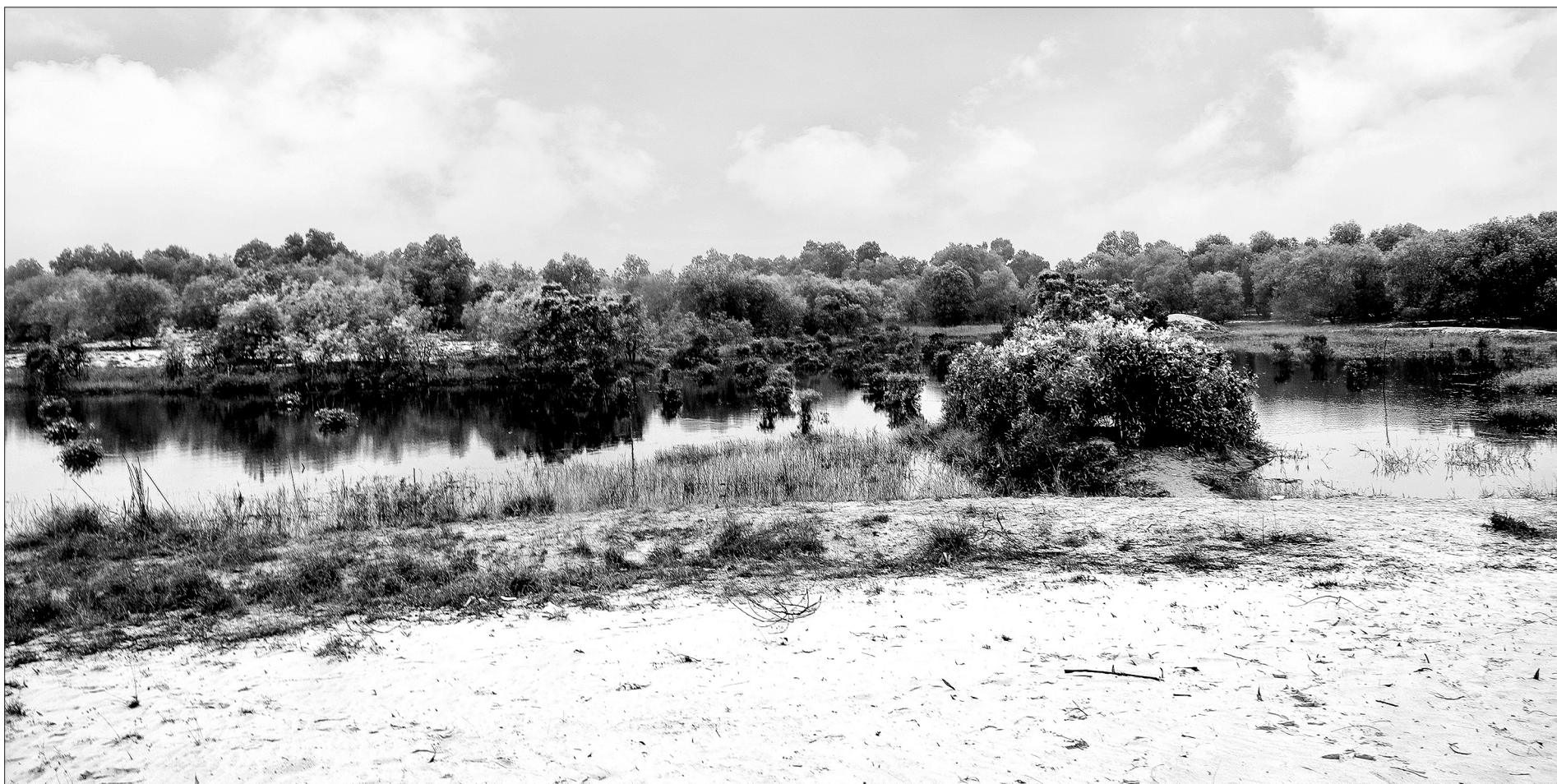
Các cánh đồng, bãi eo tràm ven biển ở xã Yên Hòa đã vắng bóng những chiếc bẫy chim mỗi, trở lại khung cảnh yên bình vốn có.