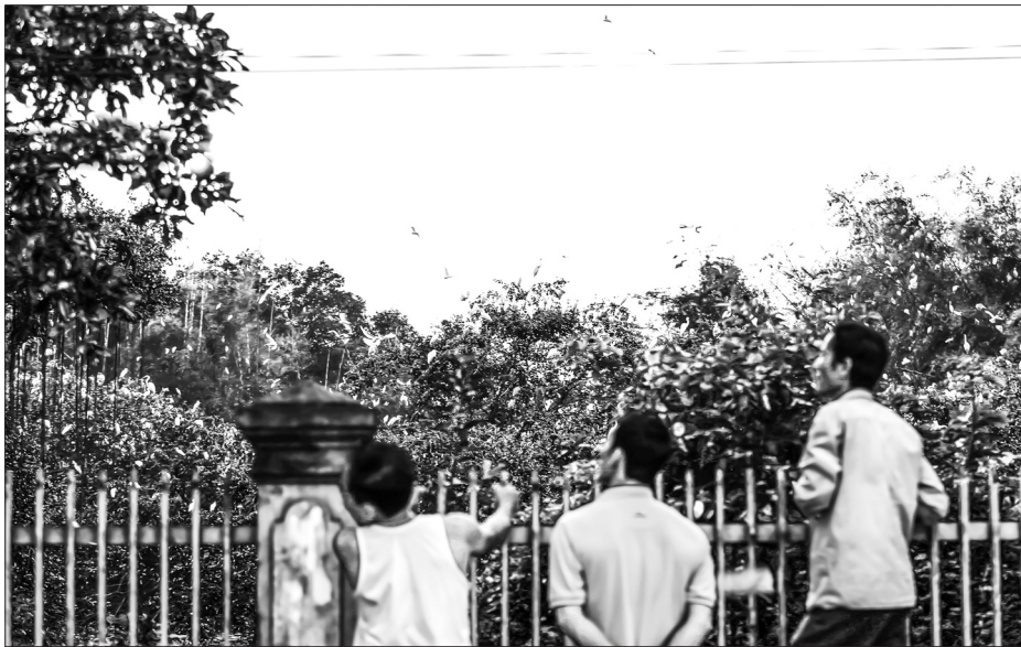
Cứ mỗi buổi chiều, khi hoàng hôn buông xuống, người dân thôn Trại Lê lại ra đầm Bù ngắm đàn cò trở về tổ.

Từ ngày đàn chim trời tìm về làng trú ngụ, người dân thôn Trại Lê (xã Quang Lộc, Can Lộc) đã chung tay bảo vệ, ngăn chặn tình trạng săn bắt để đàn chim yên tâm làm tổ, sinh sản.