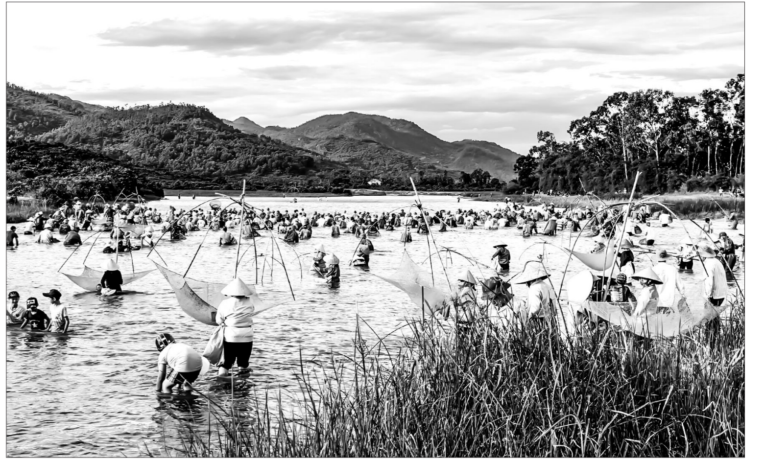
Lễ hội đánh cá Đong Hoa.