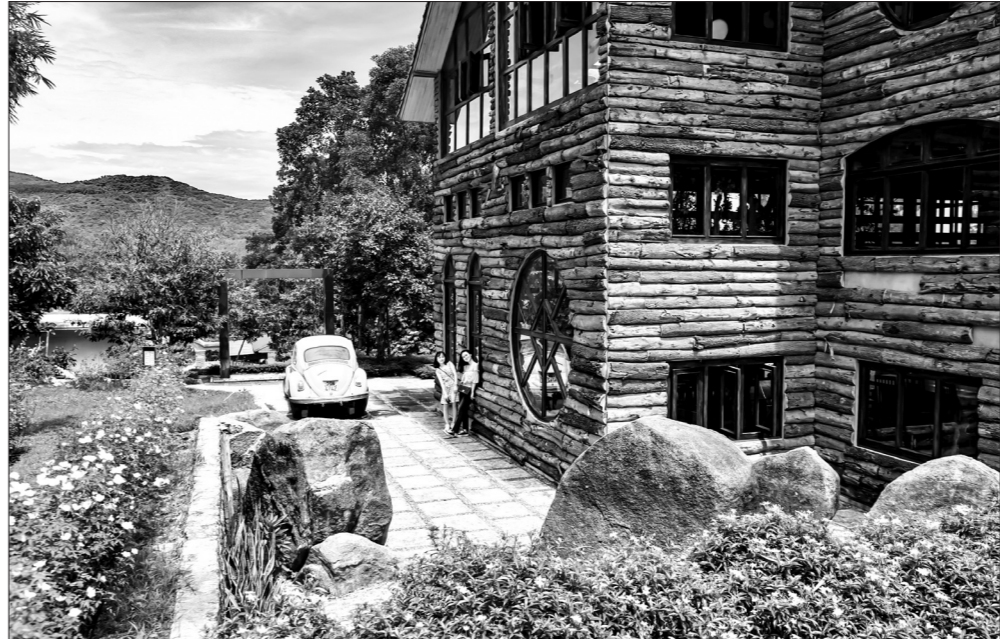
Nhà vườn Đức Đường.