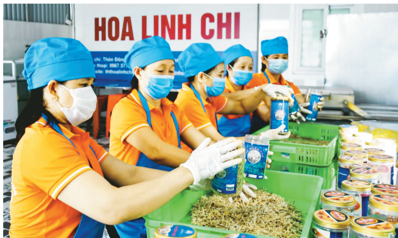
Hợp tác xã Kinh doanh và Chế biến hải sản Hoa Linh Chi huy động nhân lực, tập trung đóng gói sản phẩm để tham gia tuần lễ sản phẩm Hà Tĩnh tại Hà Nội.

TUẦN LỄ NÔNG SẢN, SẢN PHẨM OCOP, SẢN PHẨM CÔNG NGHIỆP NÔNG THÔN TIÊU BIỂU, LÀNG NGHỀ HÀ TĨNH TẠI HÀ NỘI DIỄN RA TỪ NGÀY 3 - 7/11. HIỆN NAY, CÁC ĐƠN VỊ LIÊN QUAN ĐÃ CƠ BẢN HOÀN TẤT KHẨU CHUẨN BỊ, SẴN SÀNG MANG CÁC SẢN PHẨM ĐẾN VỚI THỦ ĐÓ. (Xem tiếp trang 2) NGỌC LOAN