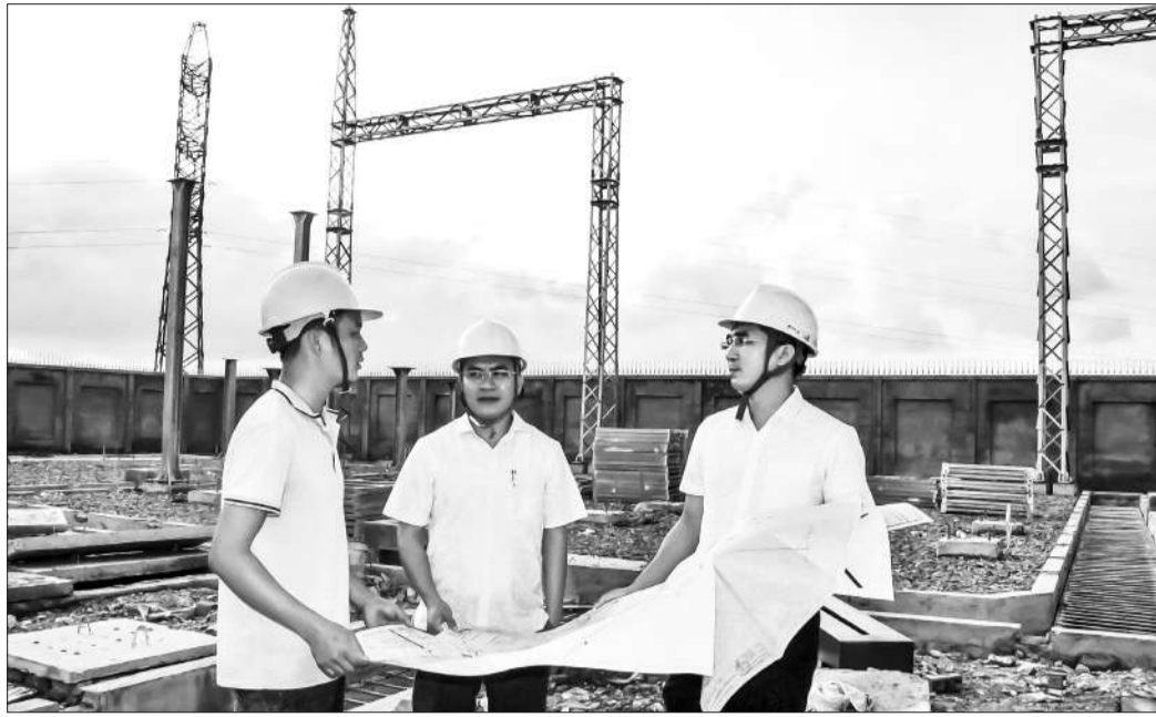
Lãnh đạo Công ty Điện lực Hà Tĩnh thường xuyên bám nắm hiện trường, hỗ trợ các đơn vị thi công trong quá trình triển khai dự án.

Được biết, hiện tại, lưới điện TP Hà Tĩnh chủ yếu được cấp từ trạm biến áp 110 kV Thạch Linh. Dự án trên hoàn thành với các lộ xuất tuyến nối với trạm biến áp 110 kV Hà Tĩnh sẽ đảm bảo nguồn cung cấp điện cho lưới điện TP Hà Tĩnh và