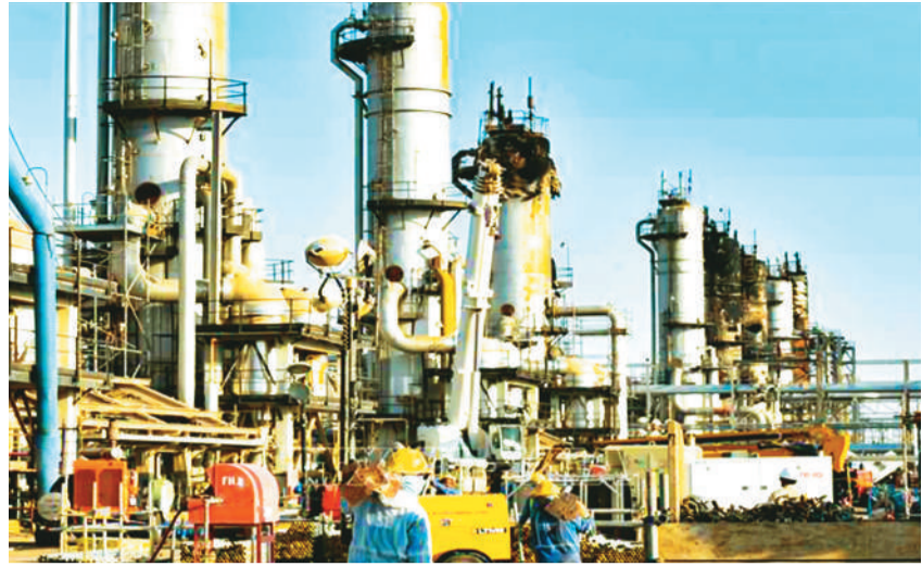
Nhà máy lọc dầu của Tập đoàn Dầu mỏ quốc gia Saudi Aramco, Saudi Arabia.

Báo Saudi Gazette đưa tin, căn cứ theo quyết định của Tổ chức Các nước Xuất khẩu Dầu mỏ và các nước đối tác (OPEC+), Saudi Arabia sẽ cắt giảm sản lượng dầu 573.000 thùng/ngày kể từ tháng 11.