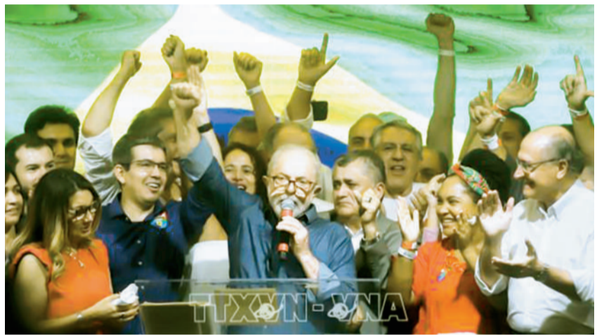
Ứng viên Tổng thống Brazil Luiz Inacio Lula da Silva phát biểu tại cuộc họp báo ở Sao Paulo vào tối 30/10/2022 sau khi kết quả bầu cử tổng thống được công bố.

Sau 12 năm, nhà sáng lập đảng Lao động Brazil (PT), chính trị gia lão luyện Luiz Inacio Lula da Silva đã quay trở lại chính trường sau khi giành chiến thắng trong cuộc chạy đua với đương kim Tổng thống Jair Bolsonaro, mở ra một giai đoạn mới mang nhiều kỳ vọng không chỉ đối với người dân Brazil mà cả với phong trào tiến bộ đang lên ở khu vực Mỹ Latinh.